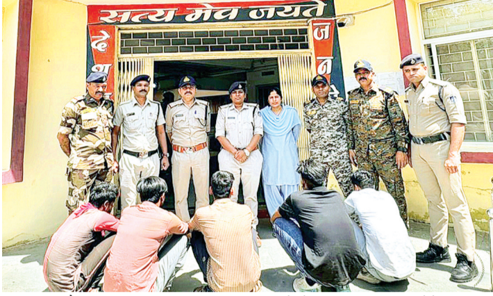
करवाए हुए हैं।

बाबा बद्रखसानी की दरगाह पर लग रहे 112वें सालाना उर्स में प्रतिदिन हजारों की संख्या में जायरीनों व पर्यटकों का हुजूम उमड़ रहा है। दिन के समय भले ही उर्स परिसर में चलह-पहल कम नजर आ रही लेकिन रात्रि में उर्स अपने पूरे शबाब पर लग रहा है। इसी उर्स में हजारों लोगों की भीड़ का फायदा उठाकर क्राइम करने वाले भी आ रहे हैं लेकिन मुस्तैद पुलिस प्रशासन के प्रयासों से उन्हें गिरफ्तार भी किया जा रहा है।